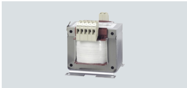
Einphasen-Transformator SIRIUS 4AM mit Schraub-/Flachsteckanschluss