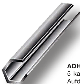
ADH02 5-kant-Profil Aufdrehhilfe für F-Stecker

mit konkaven Messern, speziell geeignet für Koaxialkabel