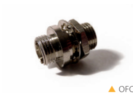
▲ OFCPC (2354)