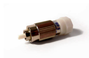
▲ ODG5 (2364)