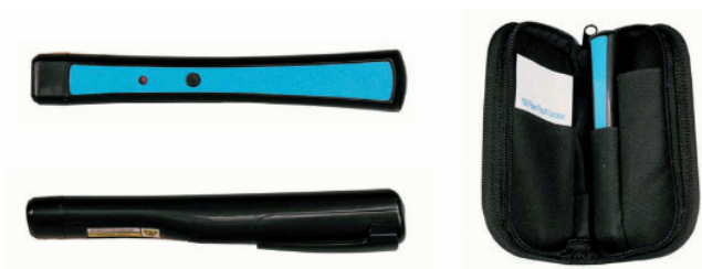
▲ ODP10 (2362)