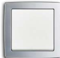
Davos (-84) mit Rahmen chrom matt (-80)