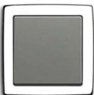
Meteor (-803) mit Rahmen davos/studioweiß (-84)