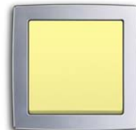
Sahara gelb (-815) mit Rahmen chrom glanz (-80G)