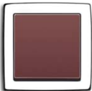
Toscana (-87) mit Rahmen davos/studioweiß (-84)

Auch die Horizontalen und Vertikalen von solo® sind nicht einfach nur gerade. Eine kaum merkbare Krümmung gibt diesen Linien jene Spannung, die sie auch aus der Ferne betrachtet noch als Gerade erscheinen lässt.