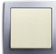
Savanne (-82) mit Rahmen chrom matt (-80)