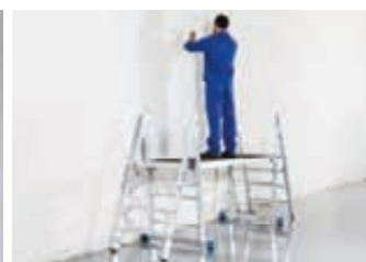
Mit 2 ProfiTritten und einer Belagbühne entsteht eine große Arbeitsfläche

Weiteres Zubehör: Belagbühnen-Set: 2 x ProfiTritt mit - Belagbühne 1,50 m x 0,60 m Art.-No. 711304 - Belagbühne 2,00 m x 0,60 m Art.-No. 911018