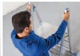
2 Haltegriffe für einen sicheren Auf- und Abstieg