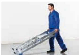
Einfach, schnell und rücken-schonend verfahrbar