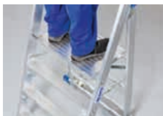
Extra große Standplattform für einen sicheren Stand