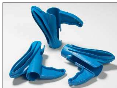
Aufziehwerkzeug HAT: erhältlich in 5 verschiedenen Größen.

Das Helawrap Werkzeug HAT wird mit dem Helawrap Schutzschlauch angewendet und ermöglicht die schnelle und einfache Bündelung von Kabeln und Leitungen. Das Design sorgt für eine gute Führung der Kabel entlang des Helawrap Schutzschlauches. Auf der ganzen Länge des Schlauches können Kabel und Leitungen ausgeführt werden. Je Packung wird ein Aufziehwerkzeug mitgeliefert. Weitere Werkzeuge sind separat erhältlich.