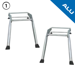
BoardStand (2 Stk.)