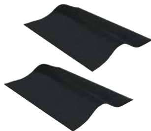
NonSlip (2 Stk.)