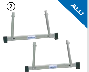
TeleSet (2 Stk.)