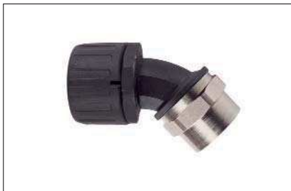
HelaGuard HG-45F, 45°-Verschraubung mit drehendem Messing-Innengewinde.