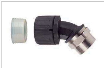
HelaGuard HGL-45F, 45°-Verschraubung mit drehendem Messing-Innengewinde inkl. Schlauchdichtung.