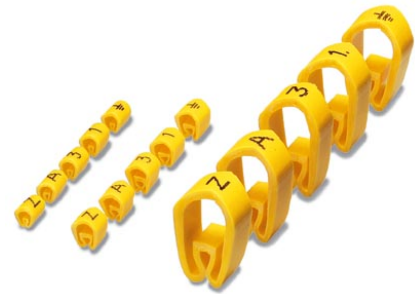
Abbildung zeigt eine Kombination aus Grossbuchstaben, Symbole und Zahlen in den Varianten PMH -0, -2 und -4

http://eshop.phoenixcontact.de/phoenix/treeViewClick.do?UID=0800530