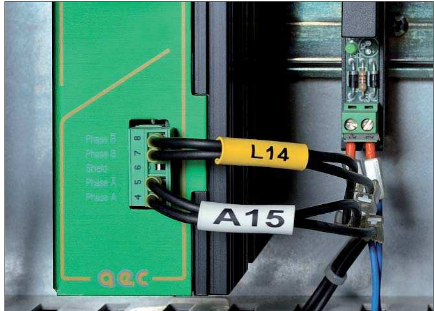
Wiederverwendbare Boxen schützen vor äußeren Einflüssen.