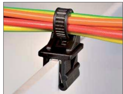
Der einteilige Befestigungsbinder T50SOSEC12 kann einfach auf Kanten aufgedrückt werden.

Weitere EdgeClip-Produkte finden Sie auf Seite 181.