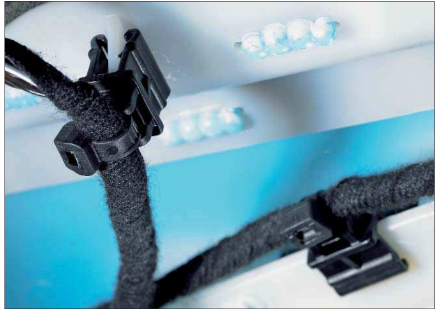
T50ROSEC10 auf eine Kunststoffkante gesteckt.

Die Kombination aus EdgeClip und Kabelbinder ist eine sehr gute Alternative überall dort, wo Lochbohrungen nicht akzeptabel und Kleber aufgrund höherer Temperaturen nicht einsetzbar sind. Anwendung findet die EdgeClip-Family zur Bündelung und Befestigung von Kabelbäumen und Schläuchen in der Elektroindustrie, im Schaltschrankbau und in der Automobilindustrie.