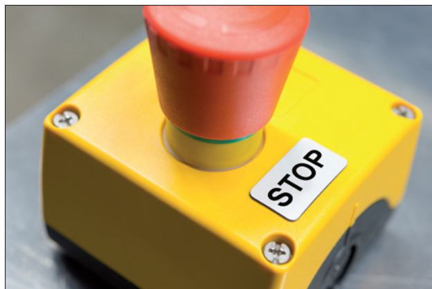
Idealer Ersatz für gravierte Schilder: Panel-Etiketten.