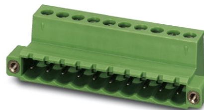
Abbildung zeigt eine 10-polige Variante des Artikels

http://eshop.phoenixcontact.de/phoenix/treeViewClick.do?UID=1825608