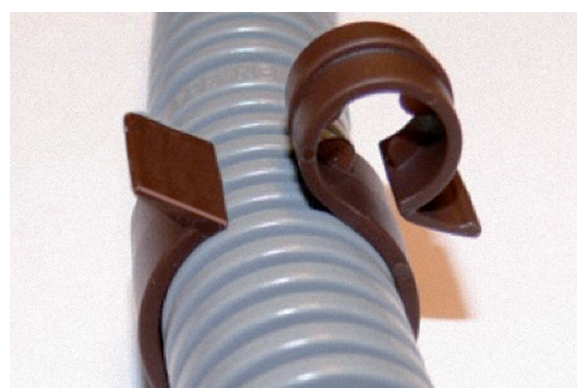
Einfach den Schlauch in den Clip drücken, das andere Ende des Clips am Gitter befestigen und der Schlauch hält.

Schnabl Stecktechnik GmbH Ratzersdorfer Hauptstraße 30, 3100 St. Pölten, Austria Telefon +43(0)2742/22167-0, Telefax +43(0)2742/22167-50 office@schnabl-steck.at, www.schnabl-steck.at