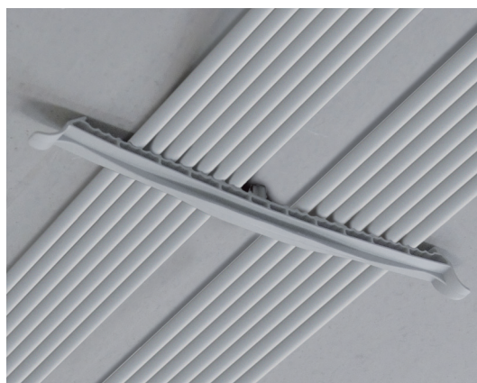
Für die trassenförmige Verlegung von Leitungsbündeln sind die KB Kabelbügel entwickelt worden.

Schnabl Stecktechnik GmbH Ratzersdorfer Hauptstraße 30, 3100 St. Pölten, Austria Telefon +43(0)2742/22167-0, Telefax +43(0)2742/22167-50 office@schnabl-steck.at, www.schnabl-steck.at