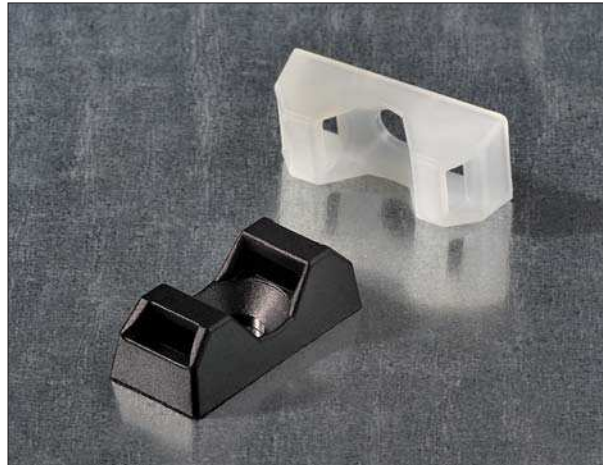
Q-Mount Montagesockel CTQM, schraubbar.

Mit ihren schlanken Abmessungen von 21 mm x 9,5 mm eignen sich die Q-mount CTQM auch für schmale Platzverhältnisse. Die gewölbte Aufnahme des CTQM fixiert das Kabel sicher im Sockel. Gleichzeitig verhindert sie ein Herausgleiten des Kabelbinders in vertikaler Position.