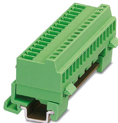
Abbildung zeigt eine 16-polige Variante

http://eshop.phoenixcontact.de/phoenix/treeViewClick.do?UID=1832811