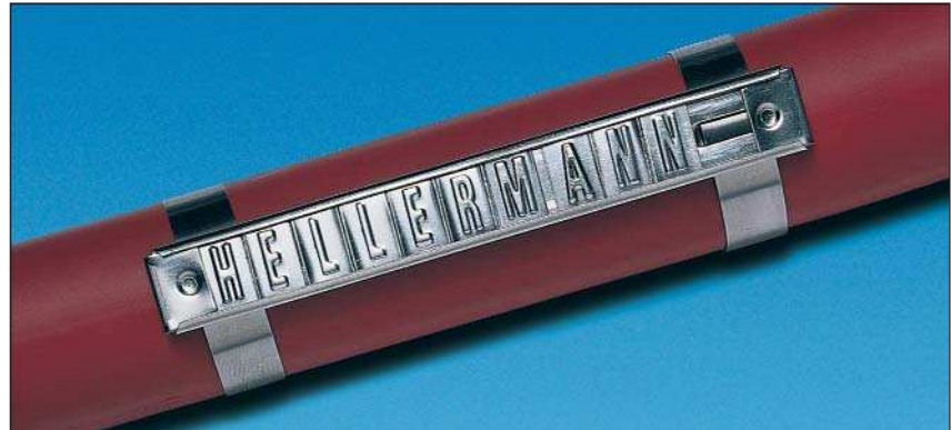
Flexibel und überall einsetzbar: Hellermark SSM.

Befestigt werden die Schilder einfach mit dazugehörigen Edelstahl-Kabelbindern der Serien MBT oder MAT bis G = 8 mm Breite. Alternativ können die zwei Bohrungen mit dem Durchmesser D = 3 mm auf dem Trägerschild zur Befestigung mittels Schrauben oder Nieten genutzt werden.