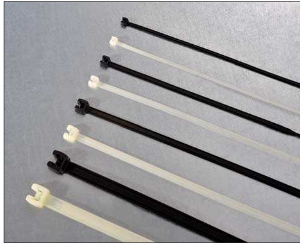
Q-tie Kabelbinder: eine große Auswahl an verschiedenen Abmessungen.

Nähere Beschreibungen der Werkzeuge finden Sie ab Seite 15.