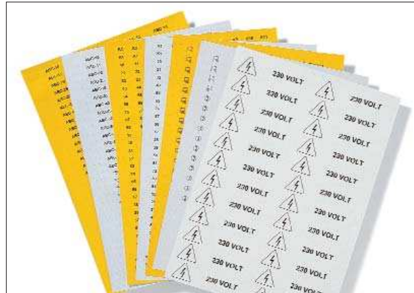
Passgenau für Helafix-Kennzeichnungsträger zur dauerhaften Kennzeichnung.

Die HFX-Etiketten sind speziell für die Anwendung mit Helafix Zeichenträgern entwickelt. Sie werden im DIN-A4-Format geliefert und können mit Laserdrucker oder per Hand mit dem Kennzeichnungsstift T82 beschriftet werden. Jeder Bogen der Etiketten HFX wird zweifarbig geliefert (Vorderseite gelb, Rückseite weiß).