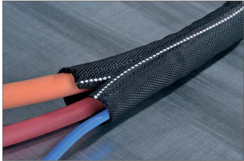
Helagaine Twist-In-FR kann leicht am weißen Kennzeichnungsfaden identifiziert werden.

Helagaine Twist-In-FR eignet sich vor allem für Bereiche, in denen hohe Anforderungen an den Brandschutz gestellt werden, wie bspw. Schienenfahrzeugbau, Luftfahrt und Schiffbau.