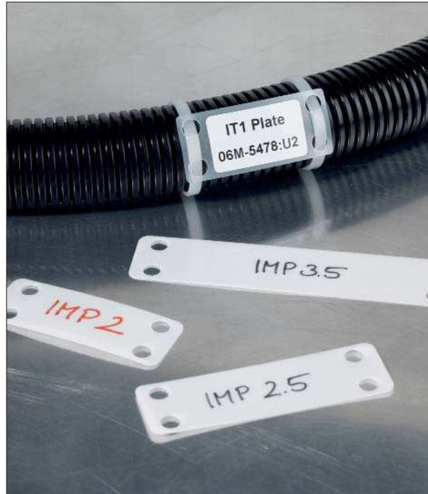
Deutliche Lesbarkeit bringt Sicherheit.

Die Kennzeichnungsplättchen eignen sich für die nachträgliche Kennzeichnung von Kabeln und Rohren. Aufgrund ihres Formates kann mehr Text untergebracht werden als auf den Schildern der Reihe AT. Die Plättchen können manuell mit den Markierstiften der Reihe T82 beschriftet oder mit passenden Etiketten versehen werden.