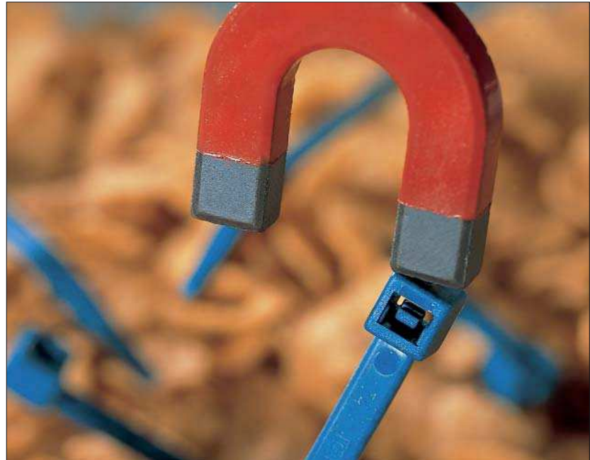
Die MCT-Kabelbinder enthalten Metallanteile.

MCT-Kabelbinder sind besonders geeignet für die Anwendung in der pharmazeutischen und chemischen Industrie sowie in der Lebensmittel- und Tierfutterproduktion. Die Kabelbinder eignen sich für das Verschließen von Transportbehältern, Gebinden und Säcken. Des Weiteren dienen die MCT-Binder zur Installation von Kabeln und Leitungen an Produktionsanlagen.