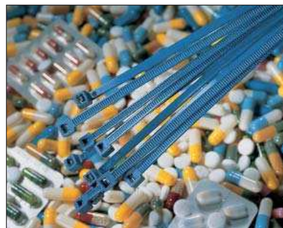
Sicherer und sauberer Produktionsprozess mit Kabelbindern der MCT-Serie.