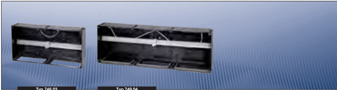
Typ 746 03