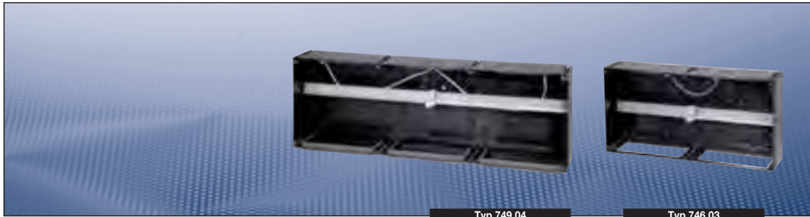
Typ 749 04