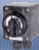
3-polig, 10 A 0-I