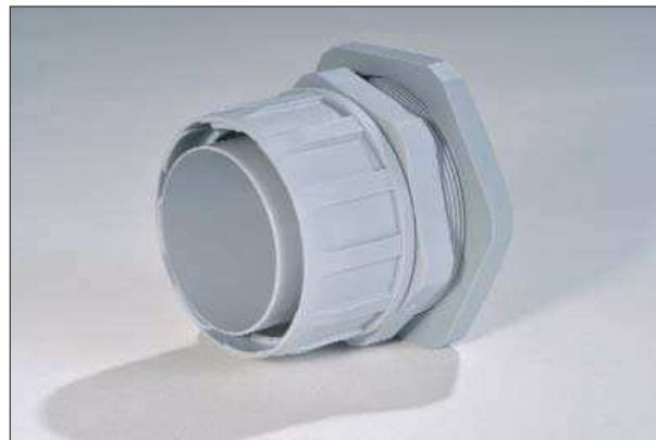
FG-M Verschraubung mit metrischem Gewinde.

Die FG-M und FG-P Verschraubungen kommen dort zum Einsatz, wo ein erhöhter Staub- und Flüssigkeitsschutz gewünscht ist. Sie werden mit den FlexiGuard-Schläuchen verwendet.