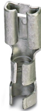
Abbildung zeigt Variante des Artikels

http://eshop.phoenixcontact.de/phoenix/treeViewClick.do?UID=3240159