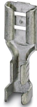
Abbildung zeigt Variante des Artikels

http://eshop.phoenixcontact.de/phoenix/treeViewClick.do?UID=3240155