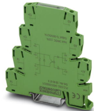
Abbildung zeigt die Variante PLC-OSC-24DC/300DC/1

http://eshop.phoenixcontact.de/phoenix/treeViewClick.do?UID=2980720