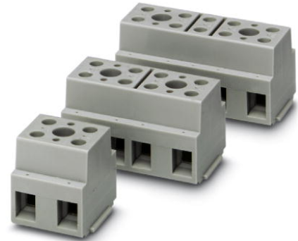
Abbildung zeigt eine Kombination aus den Varianten G 10/2, G 10/4 und G 10/5

http://eshop.phoenixcontact.de/phoenix/treeViewClick.do?UID=2716716