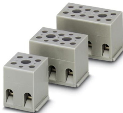
Abbildung zeigt eine Kombination aus den Varianten G 5/2, G 5/3 und G 5/4

http://eshop.phoenixcontact.de/phoenix/treeViewClick.do?UID=2716046