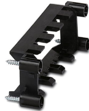
Abbildung zeigt die Variante VC-TR 1/2 M

http://eshop.phoenixcontact.de/phoenix/treeViewClick.do?UID=1852914