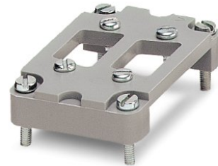
Abbildung zeigt die Variante HC-B 6-ADP/2 DSUB 9

http://eshop.phoenixcontact.de/phoenix/treeViewClick.do?UID=1775486