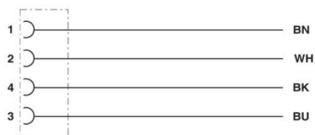
Kontaktbelegung der M12-Buchse