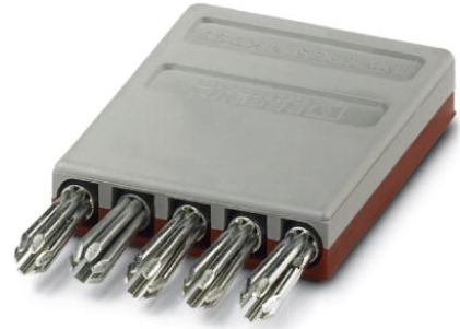
Abbildung zeigt die Prüfstecker SPB 5-MKDS 3 und SPB 5-GMKDS 3

http://eshop.phoenixcontact.de/phoenix/treeViewClick.do?UID=1301216