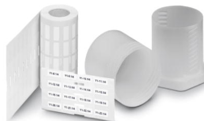
Abbildung zeigt die Produktvariante EML (20X8)R

http://eshop.phoenixcontact.de/phoenix/treeViewClick.do?UID=0818001