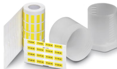
Abbildung zeigt die Produktvariante EML (20X8)R YE

http://eshop.phoenixcontact.de/phoenix/treeViewClick.do?UID=0817073