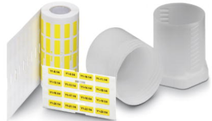
Abbildung zeigt die Produktvariante EML (20X8)R YE

http://eshop.phoenixcontact.de/phoenix/treeViewClick.do?UID=0816935