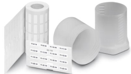
Abbildung zeigt die Produktvariante EML (20X8)R

http://eshop.phoenixcontact.de/phoenix/treeViewClick.do?UID=0816702