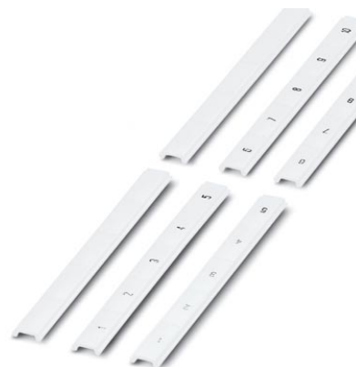
Abbildung zeigt die 15 mm breite Variante

http://eshop.phoenixcontact.de/phoenix/treeViewClick.do?UID=0809997