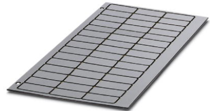
Abbildung zeigt die Variante GPE 27x12,5 SR/R

http://eshop.phoenixcontact.de/phoenix/treeViewClick.do?UID=0806903