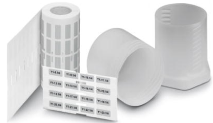
Abbildung zeigt die Produktvariante EML (15X9)R SR

http://eshop.phoenixcontact.de/phoenix/treeViewClick.do?UID=0816883