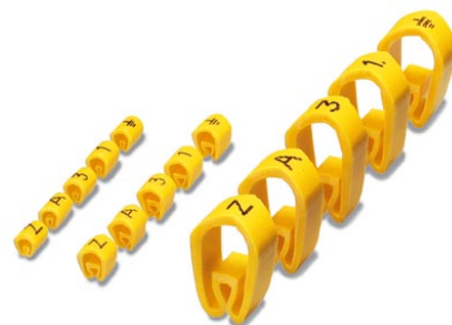
Abbildung zeigt eine Kombination aus Grossbuchstaben, Symbole und Zahlen in den Varianten PMH -0, -2 und -4

http://eshop.phoenixcontact.de/phoenix/treeViewClick.do?UID=0800491