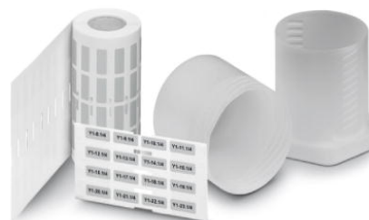
Abbildung zeigt die Produktvariante EML (15X9)R SR

http://eshop.phoenixcontact.de/phoenix/treeViewClick.do?UID=0816854