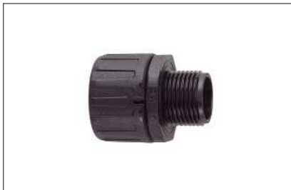
HelaGuard HG-S, gerade Verschraubung mit Außengewinde.

Verschraubungen mit UNEF- und NPT-Gewinde auf Anfrage erhältlich. Fragen Sie uns!