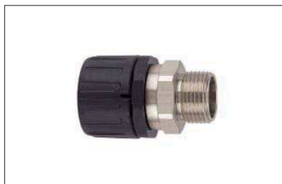
HelaGuard HG-SM, gerade Verschraubung mit drehendem Messing-Außengewinde.