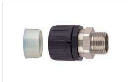
HelaGuard HGL-SM, gerade Verschraubung mit drehendem Außengewinde inkl. Schlauchdichtung.