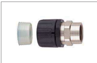
HelaGuard HGL-SF, gerade Verschraubung mit drehendem Messing-Innengewinde.