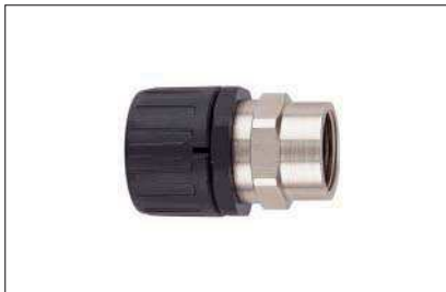
HelaGuard HG-SF, gerade Verschraubung mit drehendem Messing-Innengewinde.