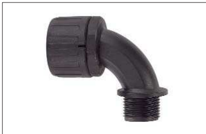
HelaGuard HG-90, 90°-Verschraubung mit Außengewinde.