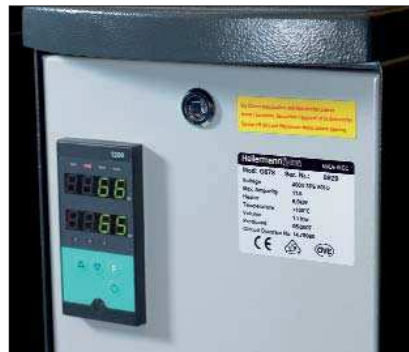
Professionelles Typenschild auf einem Heizgerät.

Diese mattsilberfarbenen Etiketten eignen sich besonders für die Herstellung von individuellen Typenschildern auf ebenen und glatten Flächen von Produktgehäusen. Die üblicherweise eingesetzten aufwendigen Aluminiumschilder werden überflüssig. Das Sortiment umfasst eine große Auswahl an Etikettengrößen. Die hohe Temperaturstabilität von bis zu +150 °C deckt einen großen Anwendungsbereich ab. Der eingesetzte Kleber ist auch für kritische Untergründe wie Kunststoffe und Lacke geeignet. Zum problemlosen Bedrucken der Etiketten empfehlen wir unsere Druckersysteme TT420+ und TT4000+ sowie die Etikettensoftware Tagprint Pro.