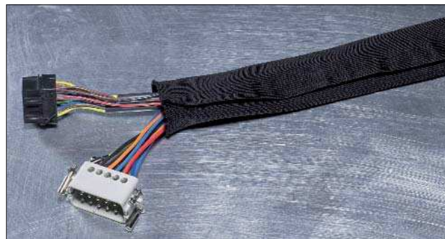
HELAHOOK bietet hervorragenden Abriebschutz.